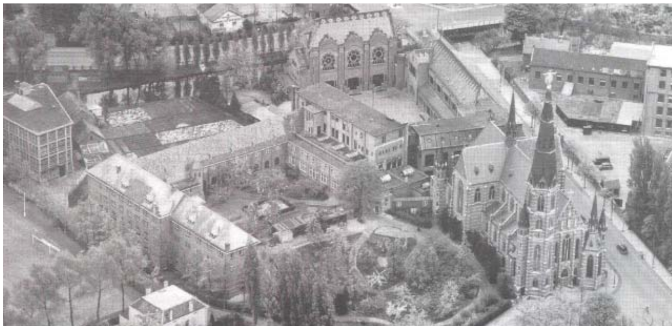
Kloostercomplex Mariënhage 1948

De buitenruimte is de intermediair tussen de gebouwen en de openbare ruimte. Hier komen functies samen, hier verenigen zich landschappelijke en stedelijke sferen, hier verankert DomusDELA in de stedelijke structuur, stil en sereen zoals de plek het past.