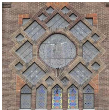
Motief Dom Bellot