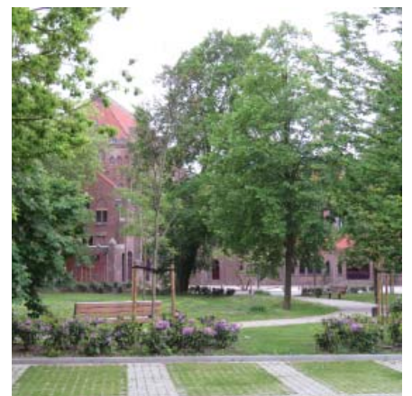
De Dommeltuin met parkeren