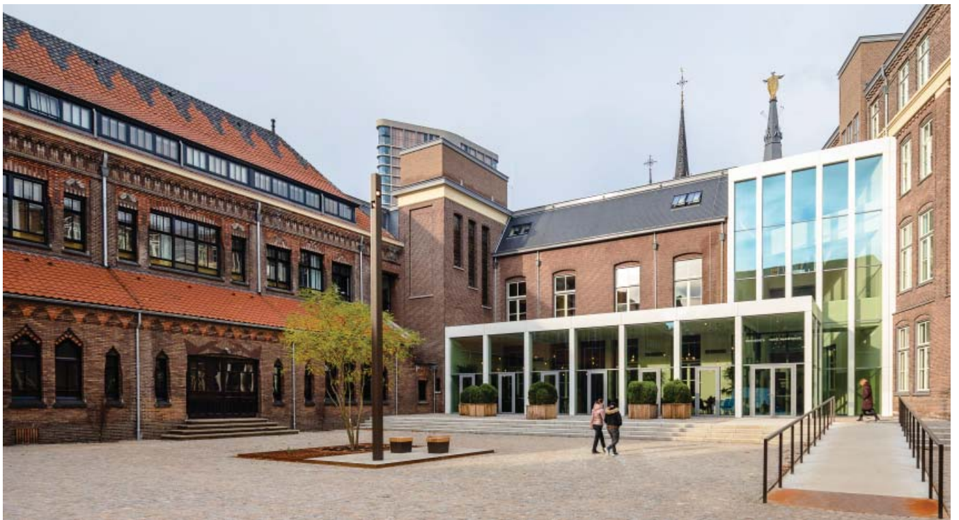
Binnenplein met entree naar foyer en terras