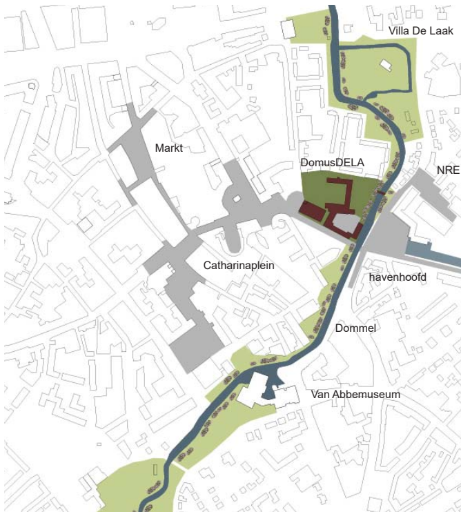
Schakel in de stad