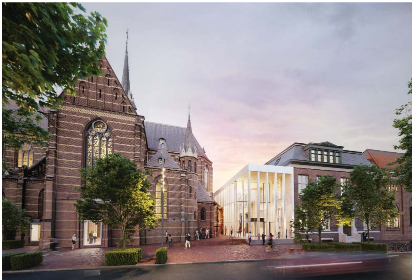
Entree Kanaalstraat (Render van VERO Visuals)