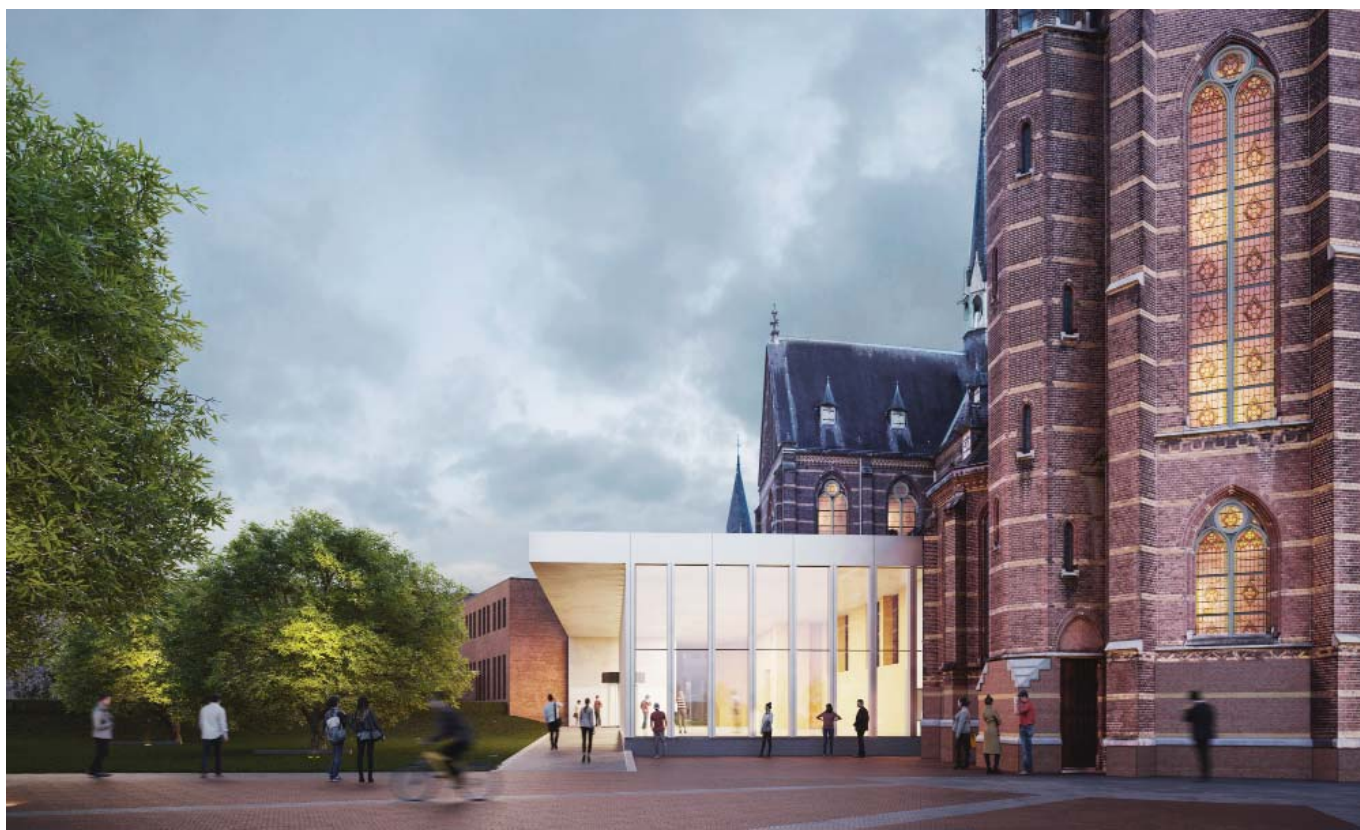
Entree centrumzijde (Render van VERO Visuals)

Verborgen kloostercomplex is nieuw knooppunt in de stad