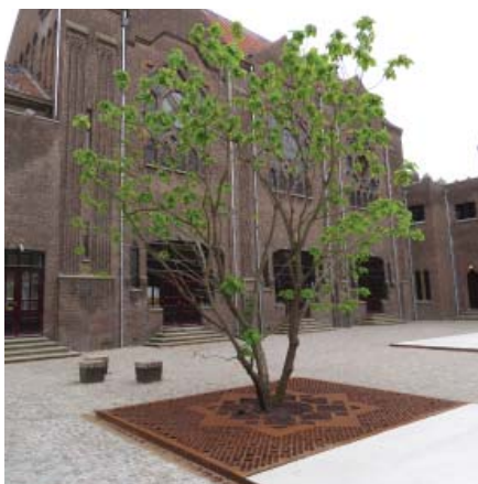
Boomrooster en goten met motief Dom Bellot