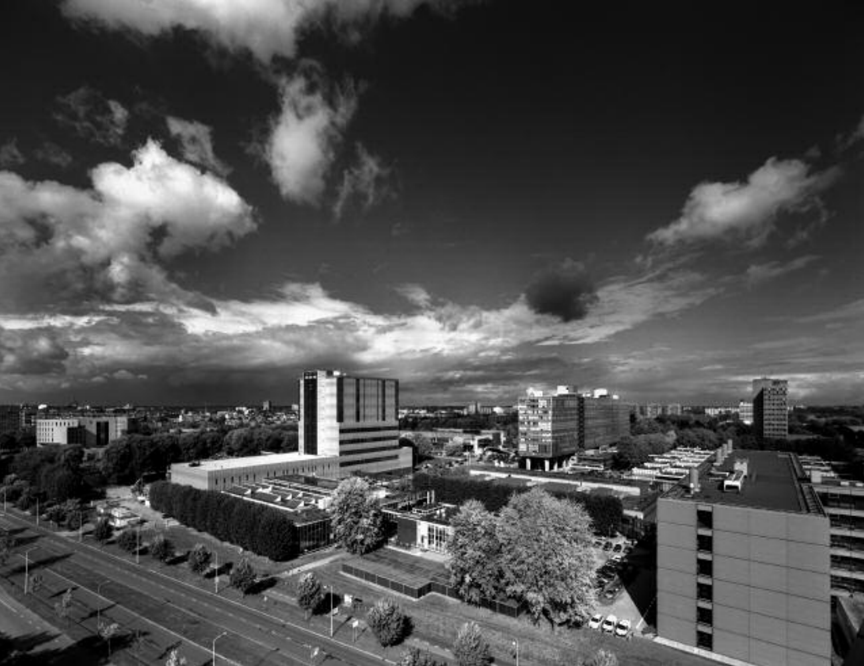
Technische Universiteit Eindhoven en Brainport